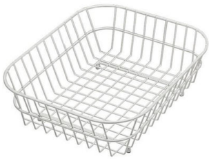
Cesta blanca de acero inoxidable 8612 000