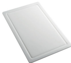
Tabla de corte de HPDE 8657 001