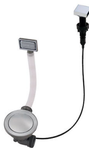
Desagüe automático Space - PA 8407 108