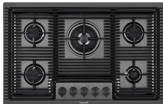
Placa de cocción Milanello Gun Metal 5F 7682 006