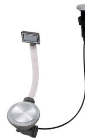
Desagüe automático Space Push - PP 8407 116