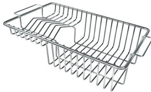
Cesta portaplatos inox 8100 201