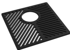
Griglia Black 8100 651