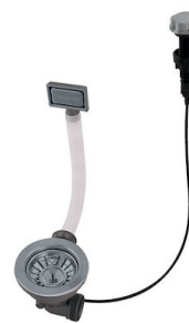
Desagüe automático Gun metal - PG 8407 110