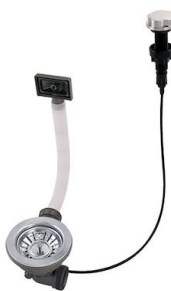
Desagüe automático 8407 000