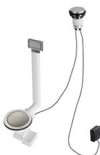
Desagüe automático Space Light - PL 8407 117