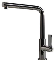
Monomando Omega Plus Gun Metal 8498 856